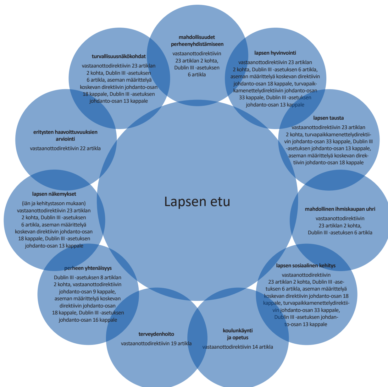
Kaavio 1. Lapsen etu. Muokattu EASOn käytännön oppaasta lapsen edusta turvapaikkamenettelyissä (tulossa).